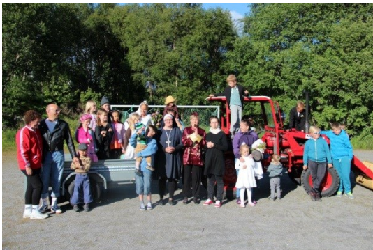
Jonsokbrylaup og sykkeløp

Grendalaget har ein langsiktig plan om å utvide tilbodet på denne plassen med leikeapparat, ballbinge med meir. Vi vonar dette vil gi eit godt utendørs samlingsrom som vil styrke krinsen. Første del av denne planen er å få på plass denne gapahuken. Dette er no fremste prioritering for grendalaget.