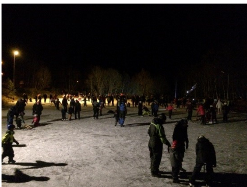
Isbana er mykje brukt