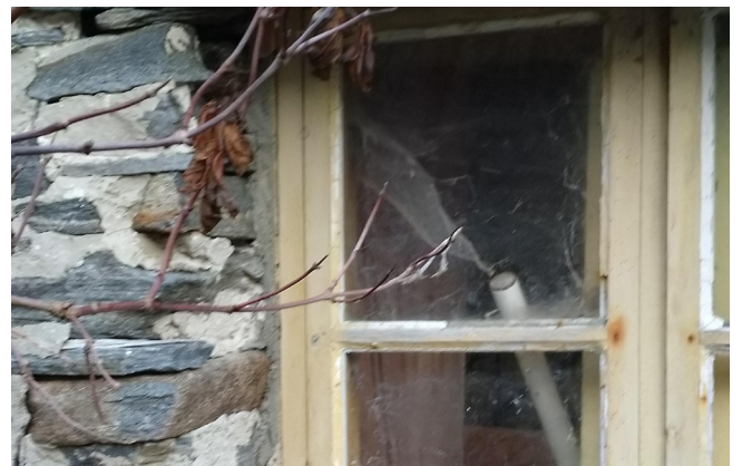
Detalj frå huset som har stått her sidan 1880.