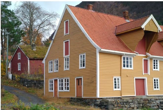
Garvarbuda og Ristegarden