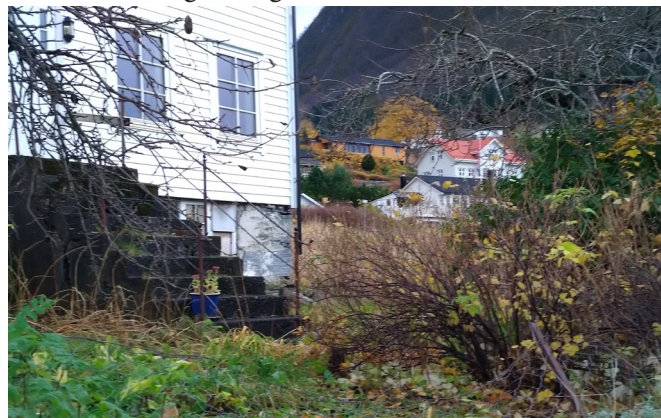
Detalj frå Naustvegen