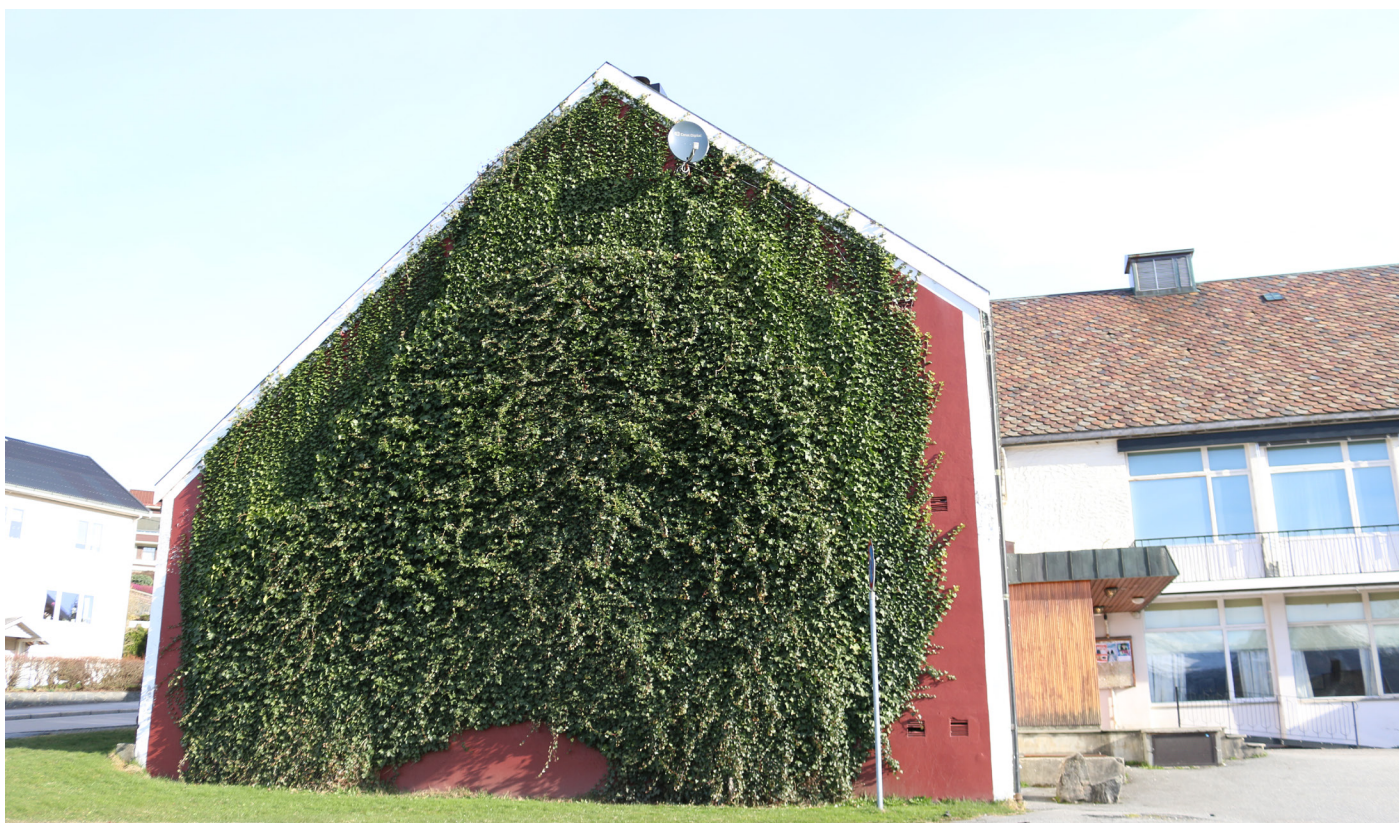
Samfunnshuset i Volda.

Idrett: samlokasjon og tettere samarbeid. Student + bygda = STYRKE.