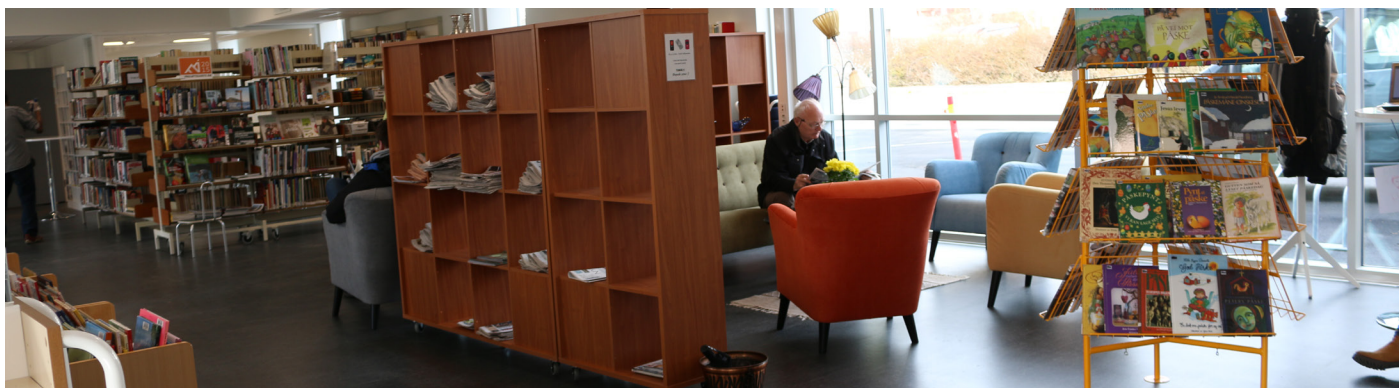
Biblioteket i Volda i nye lokaler i Rådhuset.