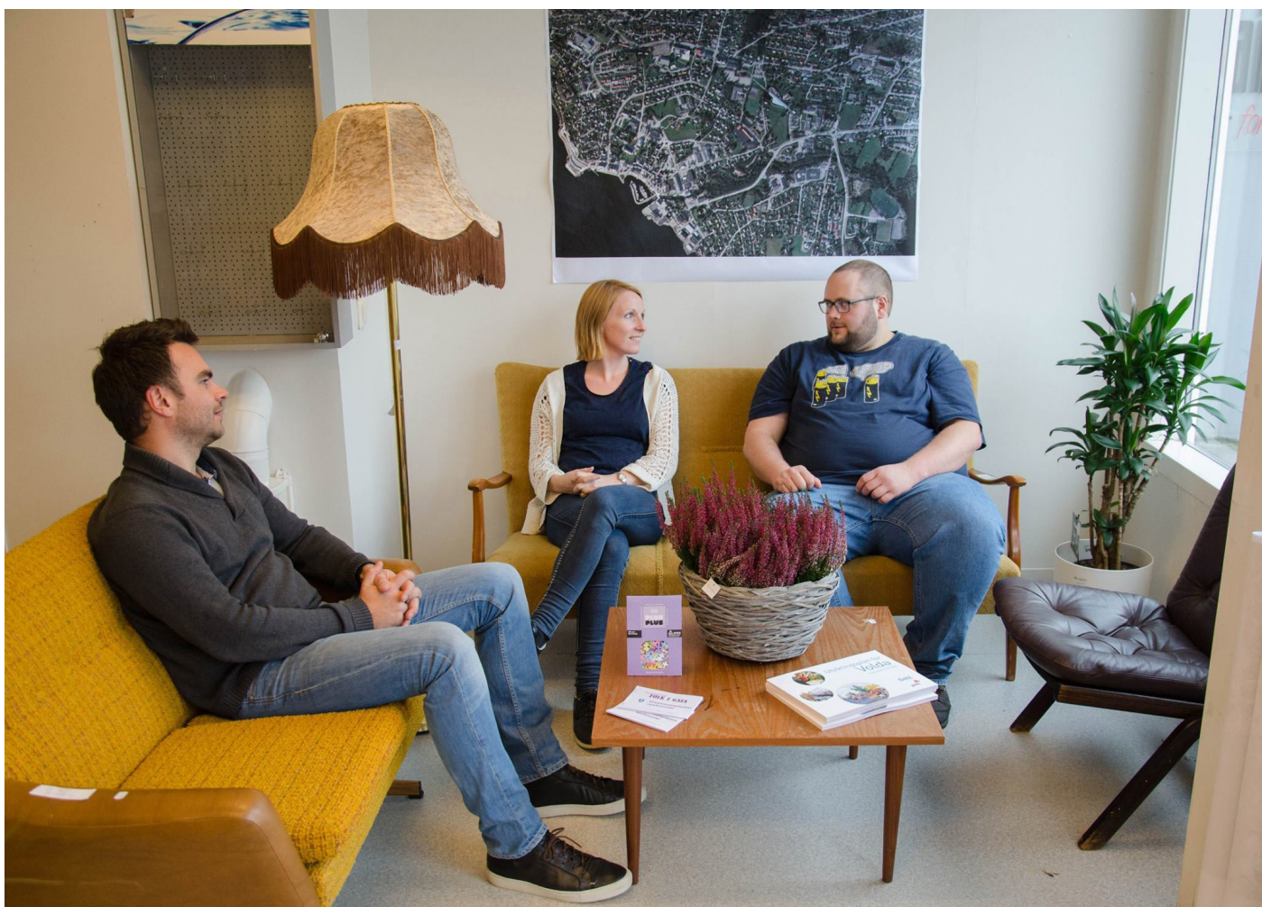
Bilete frå prosjektkontoret "Folk i gata".

Gatelys. God eldreomsorg. Synleg politi.