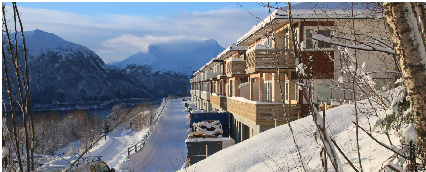
Nye bustadar i Volda tettstad.