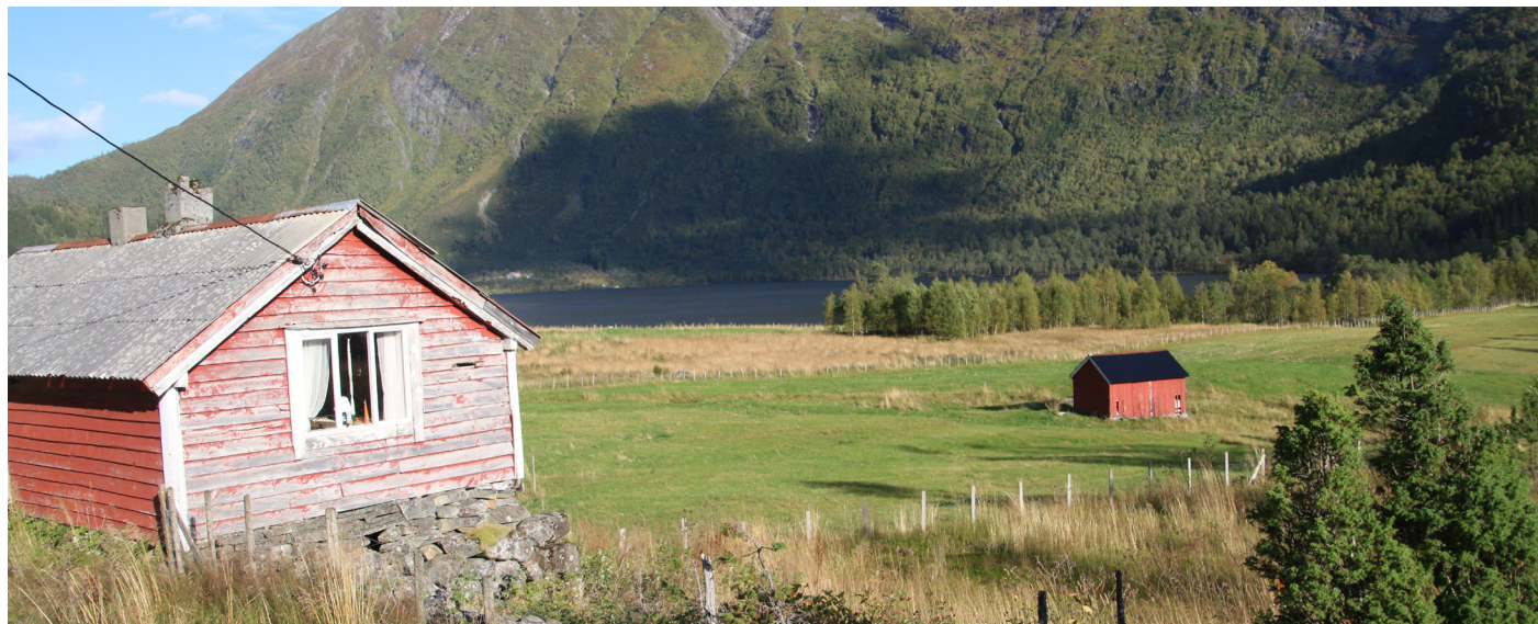
"Det er mange fine plassar i Volda, kulturlandskapet er viktig."

Unngå forsøpling. Naturen ligger der og la den ligge i fred.