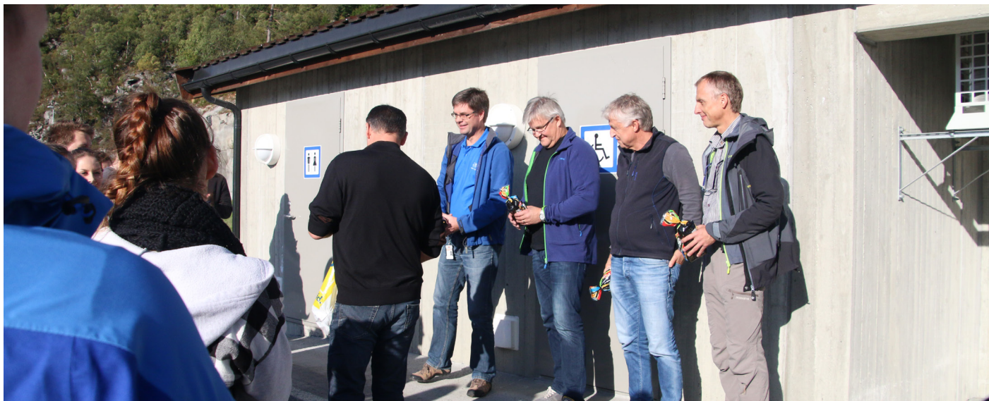
På befaring i Austefjorden; Statens vegvesen, Volda kommune og naturvernforbundet - saman med studentar frå Høgskulen i Volda.

La dei få gode vilkår og arbeidsfred, kamp mot sentralisering.