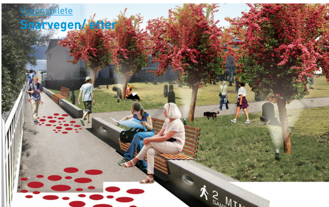
Visjonsbilete Snarvegen/ etter