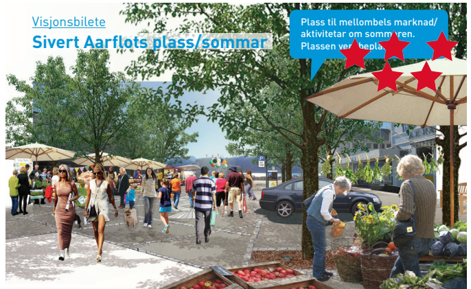
Visjonsbilete Sivert Aarflots plass/sommar