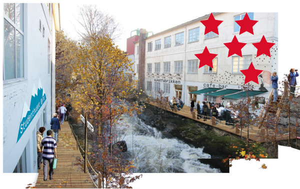
Elvdalen/etter (utan passasje under brua)