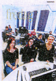
FAKSIMILE: Sunnmørsposten 9. mars: Andre fag sliter med lav kvinneandel.